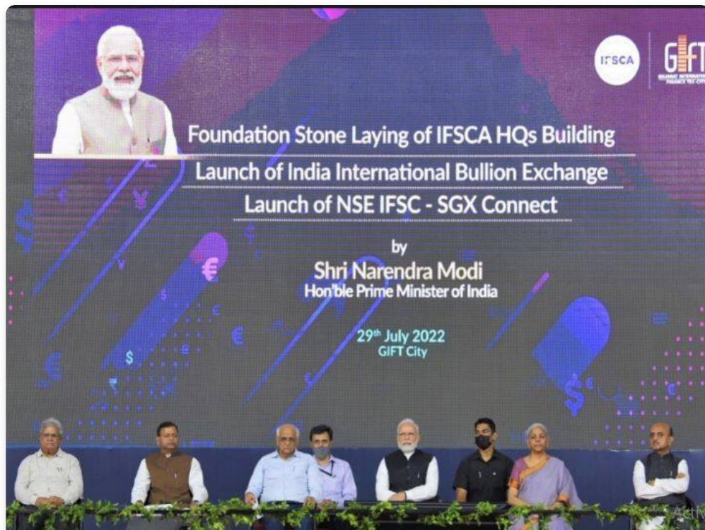
पहला अंतरराष्ट्रीय गोल्ड एक्सचेंज, फोटो